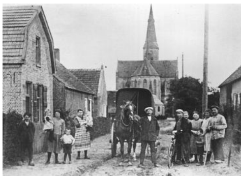
Kapelstraat +/- 1920