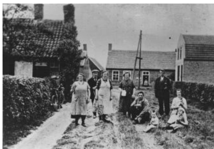
Oude Hoofdweg +/- 1940