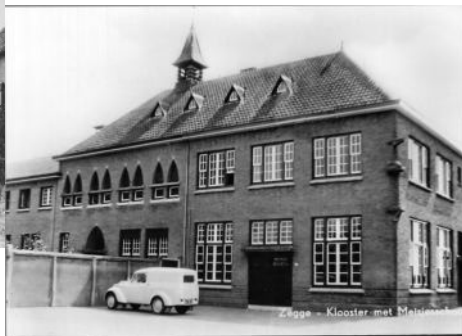
Klooster en Mariaschool +/- 1950